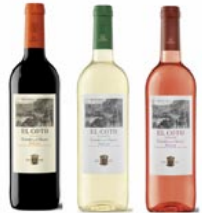
Bodegas El Coto La Rioja D.O. Ca.

El Meson rosado 6 x 0,75 1 Flasche Art.-Nr. 11220909