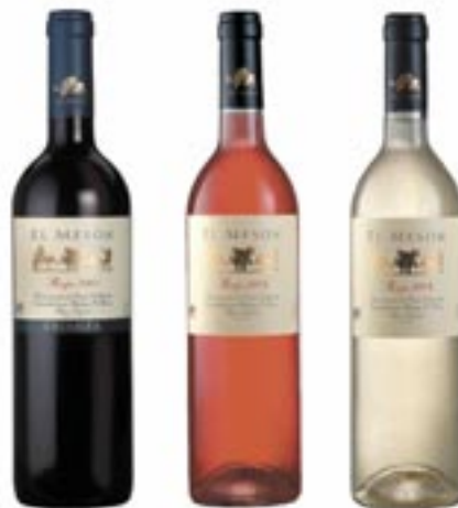
Bodegas El Meson Rioja Alta D.O. Ca.

Baron de Ley rosado 6 x 0,75 1 Flasche Art.-Nr. 11220903