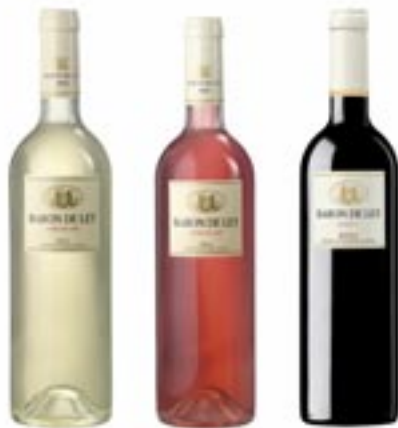
Bodega Baron de Ley S.A. Rioja Alta D.O. Ca.

Das Anbaugebiet wird unterteilt in drei Bereiche: Rioja alta (westlich, südlich des Ebro), Rioja baja (östlich, südlich des Ebro) und die Rioja Alavesa (nördlich des Ebro). Der beste Rioja-Wein ist der Rote. In Spanien sind diese Weine sehr beliebt.