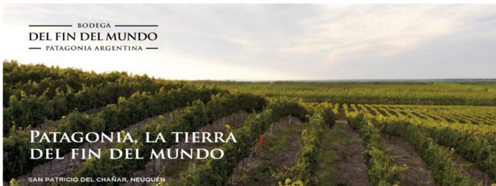
Postales Malbec – Fin del Mundo 6 x 0,75 1 Flasche Art.-Nr. 12410104

Die Kellerei gilt als erfolgreicher Pionier. Im Jahr 2003 wurden die heutigen Kellereigebäude eröffnet mit den weltweit modernsten Technologien und Maschinen der internationalen Weinbranche, die die Inhaberfamilie zusammen mit ihrem Winemaker Marcelo Miras und ihrem Berater Michel Roland aus Frankreich plante. Es ist das Ziel von Bodega del Fin del Mundo, mithilfe der modernsten Technologie und den einzigartigen Eigenschaften des patagonischen Terroirs Weine von höchster Qualität zu erzeugen.